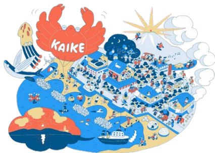
皆生温泉エリアのビジョンイラスト イラスト:にしまたひろし

「ぐるぐるかいけ」とは「ぐるぐるかいけ」は、まち全体を使ったマルシェイベント。2021年に皆生温泉街の未来の暮らしを魅せる社会実験としてスタートし、2023年度グッドデザイン賞を受賞しました。社会実験を踏まえて2024年から、地域の方々や宿泊客が、皆生温泉でもっと豊かな時間を過ごせるような事業として継続していきます。イベントでは、飲食をはじめ、子どもでも楽しめる体験型のワークショップなど移動式屋台スタイルで数多くの出店が並びます。そのほか、バスツアー、音楽アワードなど体験できるコンテンツが盛りだくさん。海を開くと合言葉に、温泉宿の軒先から隣接する都市公園へ、観光客も地元の人もお店の人も、ぐるぐる歩いて楽しむ「うごくまち」を体現、地元の魅力を見つめ直す機会です。今年は、小規模の「ぐるぐるかいけ」を皆生温泉エリアの複数の場所で開催。 みんなで作るまちのカタチ 今皆生温泉では「ぐるぐるかいけ」をはじめ、空き物件を活用したリノベーションやシアター図書館などさまざまな活動が企画されています。これらの活動を、地域の中高生や温泉宿、飲食店など多くの人々と協力して、形にしたいためのアイデア会議が定期的に開催されています。来たる11月開催の「ぐるぐるかいけ」に向けて、10月6日に参加型会議「ぺちやくちゃかいけ」が開催。参加無料で飛び込みOK!! 皆生のまちを楽しみたい、まちにしたい、作戦会議で、一緒に妄想してみませんか?